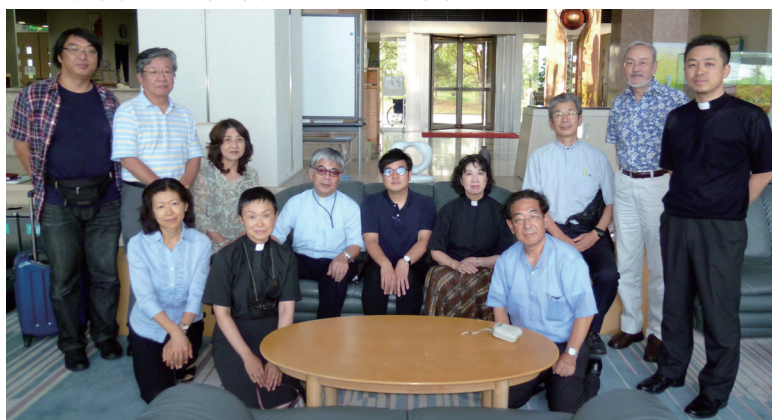
2012年9月・日本聖公会宣教協議会東京教区参加者

追いやられた人々、苦難の中にあつてやつとの思いで、小さな叫びを上げている人々と出会い、仕えることです。